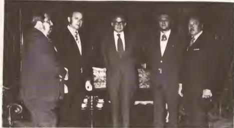
E delegacion Arubano di eilandsraad a bishita Colombia na 1976 tambe y aki nos ta mira miembronan di e delegacion den compania di presidente di Colombia, señor Alfonso Lopez Michelsen.

Na aña 1976 misionnan politico a continua pa Colombia, Costa Rica, Panama, despues pa Hulanda, Inglaterra, Merca na unda a worde bishita e organisacionnan O.A.S. y United Nations.